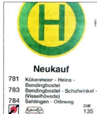
Die neue Haltestelle.

Fahrgäste des Bürgerbuses aus den umliegenden Ortschaften erreichen damit den E-neukauf ohne größeren Fußweg. Fahrgäste der Linie 782 aus der Ortschaft Kirchlinteln können den Markt ebenfalls gut und ohne Umsteigen erreichen, denn die Bürgerbusse fahren nach dem Bedienen der Linie 782 jeweils über